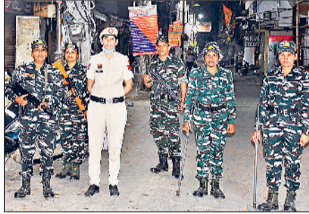
रोहतक। किला रोड मार्केट में तैनात पुलिस बल तैनात व आईटीबीपी के जवान।

यहां यहां है नाकाबंदी: सुखपुरा चौक, सोनोपत स्टैंड, अशोक चौक, झुंजर रोड, सरकूल रोड, जींद रोड, भिवानी रोड, हिंसार रोड, सोनोपत रोड, दिल्ली रोड पर पुलिस ने नाके लगाए हुए हैं। जहां ट्रैफिक पुलिस के जवान भी तैनात हैं। इस दौरान शराब के नशे में वाहन चलाने वाले लोगों पर भी शिकंजा कसा जा रहा है।