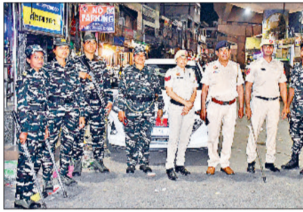
रोहतक। भिवानी स्टैंड के पास तैनात आईटीबीपी के जवान व पुलिस बल तैनात।